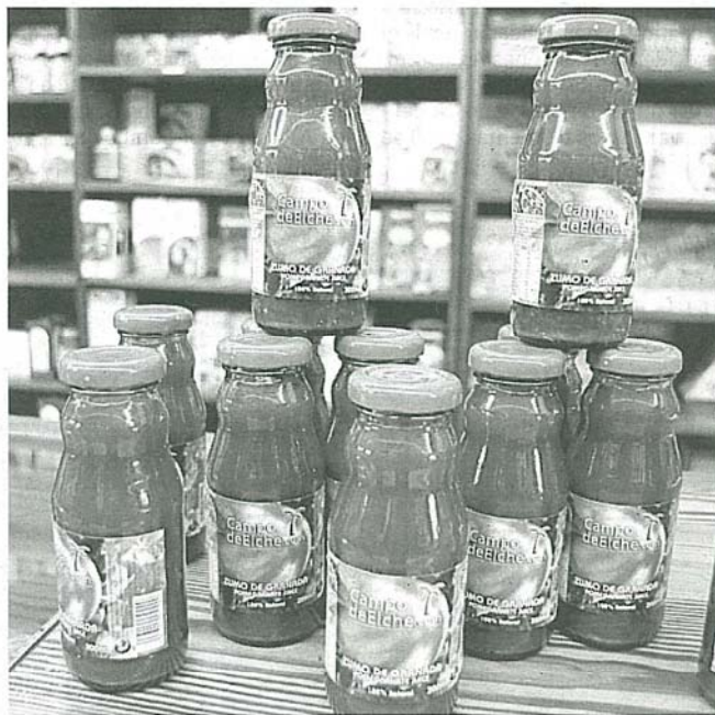
SALUDABLE. Varias botellas de zumo de granada.

nada se exporta principalmente a Francia, Gran Bretaña, Países Bajos y Polonia, mientras que tanto en Estados Unidos como en México, hay una gran demanda de zumo.