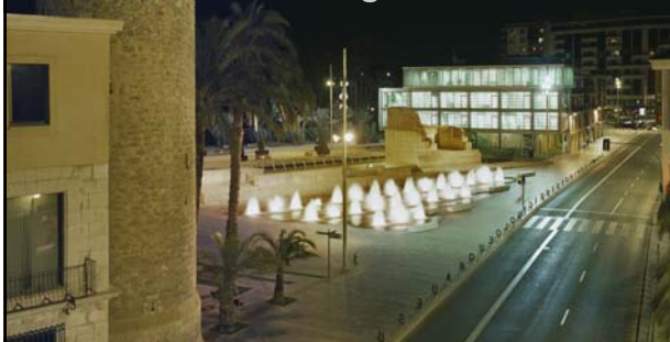
El Plan Estratégico de Elche. 1997-2007 Metodología.