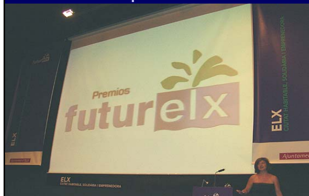
La convocatoria de los Premios Futurelx.