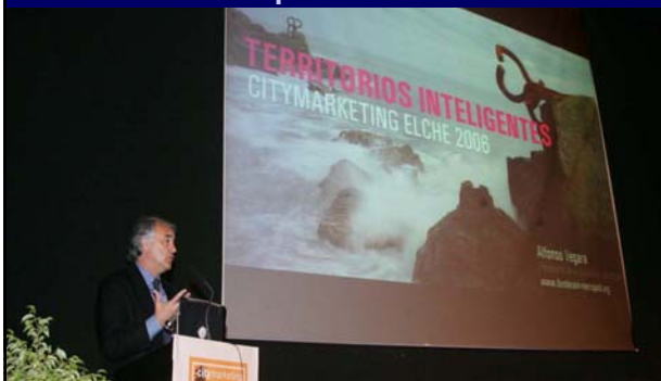
El patrocinio de diversas actividades incluidas en los planes de acción.