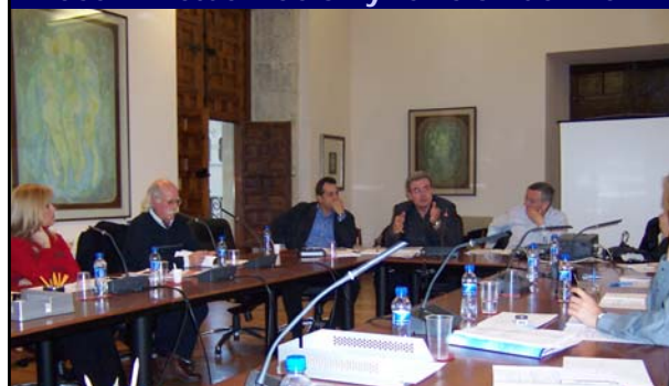
El establecimiento de un sistema de seguimiento y actualización del Plan.